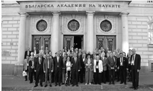
ALLEA 19. Ģenerālās Asamblejas dalībnieki, 2018. g.17. maijā

Eiropas Zinātņu akadēmiju apvienības ALLEA ( All European Academies ) Ģenerālās Asamblejas 19. sanāksme notika š.g. 16.–18. maijā Bulgārijas Zinātņu akadēmijā. Ģenerālās Asamblejas 19. sanāksmē piedalījās 59 zinātņu akadēmijas no 40 valstīm. Ģenerālās Asamblejas darba kārtībā bija trīs lielu jautājumu grupas: zinātniskais simpozij, Stīla kundzes balvas pasniegšana un ALLEA Ģenerālās Asamblejas sēde. Pasākuma moto bija "Zinātne politikai un politika – zinātnei" ( science for policy, and policy – for science ).