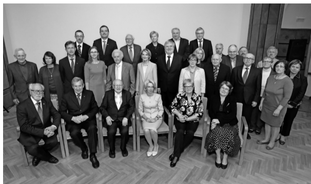
Krājuma "Latvija un latvieši" autori, amatpersonas

Latvijas Zinātņu akadēmijas prezidents Ojārs Spārītis, atklājot akadēmiskā rakstu krājuma "Latvija un latvieši" atvēršanas svinīgo pasākumu 23. maijā, uzsvēra, ka ir īstenojusies zinātnieku vēlme veltīt kādu fundamentālu darbu Latvijas valsts simtgadei. Atgādinot, ka 2013. gadā iznākušais krājums "Latvieši un Latvija" jau veica savdabīgu dziļurbumu Latvijas kultūrā, vēsturē, arheoloģijā,