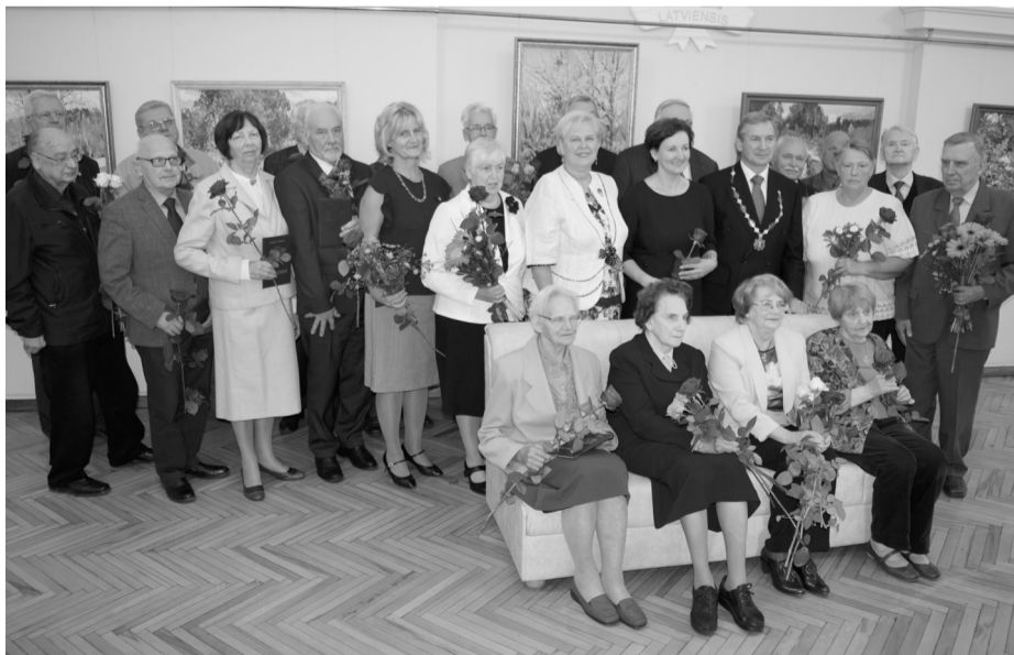
23 septembrī svinīgā pasākumā Latvijas Zinātņu akadēmijā pasniedza diplomus šogad ievēlētajiem valsts emeritētajiem zinātniekiem. Pasākumu vadīja Valsts emeritēto zinātnieku padomes priekšsēdētāja akadēmiķe Baiba Rivža. Zinātniekus uzrunāja un diplomus un nozīmes pasniedza izglītības un zinātnes ministre Māriete Seile un LZA prezidents Ojārs Spārtiis