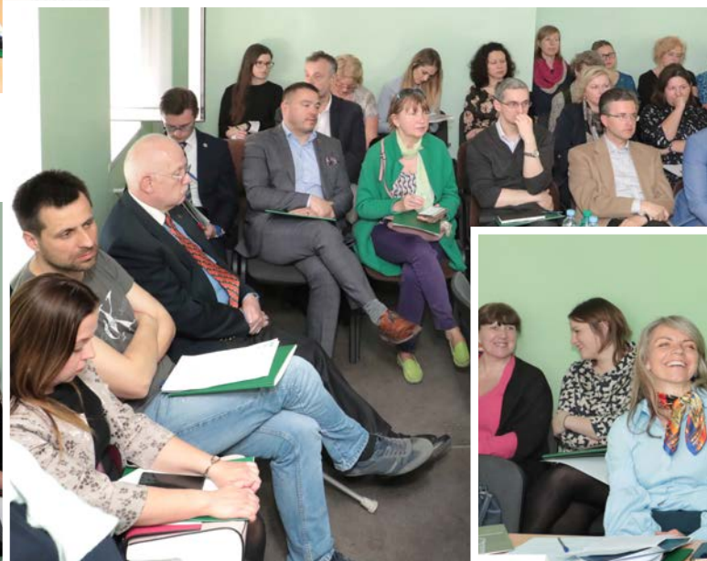
Seminārs-diskusija "Impulss mediācijai" 25. aprīlī.