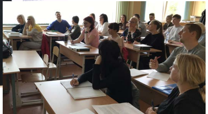
Liepājas filiāles studenti vieslekcijā.