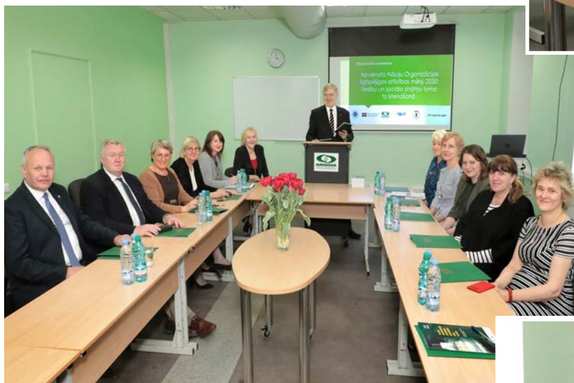
Starptautiskā konference "Apvienoto Nāciju Organizācijas ilgtspējīgas attīstības mērķi 2030: tiesību un sociālo zinātņu loma to īstenošanā" Juridiskajā koledžā 26. aprīlī.