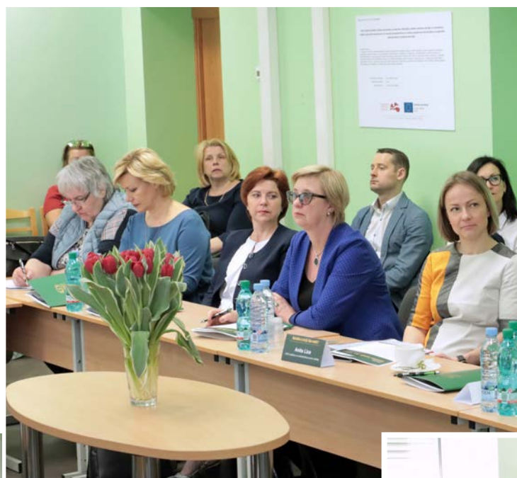
Latvijas Koledžu asociācijas un Juridiskās koledžas kopīgi rīkotā konference "Koledžas Latvijā: Quo vadis?" 24. aprīlī.