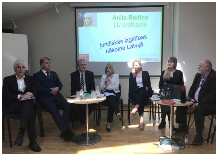
Latvijas Juristu dienu atklāšanas pasākums Latvijas Republikas tiesībsarga birojā 23. aprīlī.