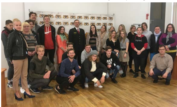
Valmieras Valsts ģimnāzijas jauno juristu un koledžas studentu grupa Rīgas Pašvaldības policijā.

Pavasārī Juridiskās koledžas studenti un Valmieras Valsts ģimnāzijas Jauno juristu skolas dalībnieki iepazīnās ar tiesu eksperta profesiju, tiesu ekspertīžu veidiem un tehnisko aprīkojumu Valsts tiesu ekspertīžu birojā. Pēc tam apmeklējām Rīgas Pašvaldības policiju, kur tikām