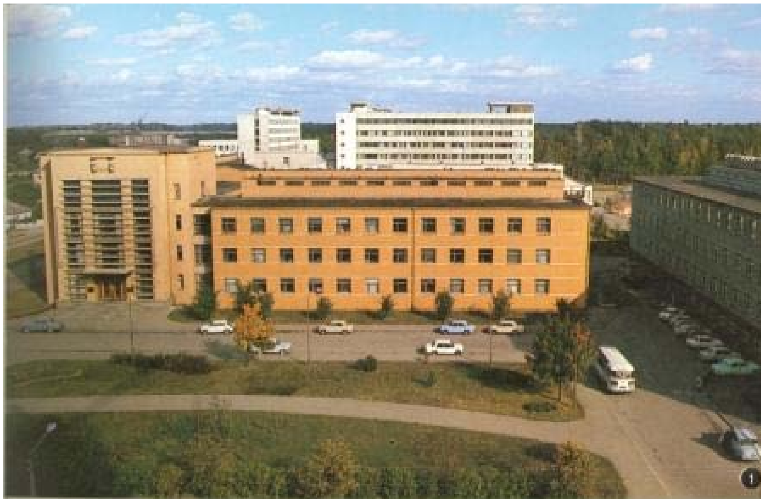
Teikas zinātnisko institūtu komplekss Šmerlī