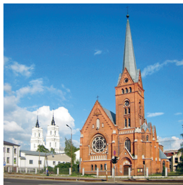
34. att. Daugavpils. Mārtiņa Lutera luterāņu draudzes baznīca. 1891–1893. V. Neimanis

Vispamanāmākā jūgendstila celtnes Daugavpilī ir īres nams ar veikaliem Saules ielā 41 (36. att.). Fasādes kompozīcijas shēmu ēkas projekta autors ir paņēmis no publicēta parauga, šajā gadījumā — Leipcigas