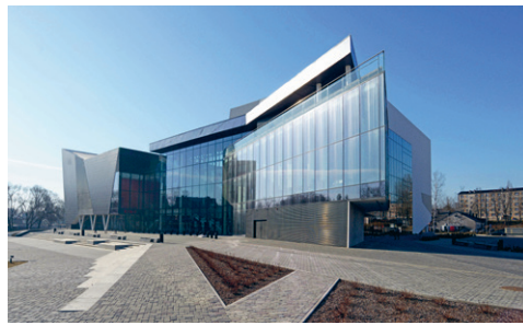
46. att. Rēzekne. Austrumlatvijas reģionālais daudzfunkcionālais centrs “Gors” Pils ielā 4. 2010–2013. U. Balodis, D. Bikše, D. Levane un citi