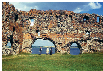
1. att. Livonijas ordeņa pils drupas Ludzā. 1972. g. foto

Ludzas pils paliekas joprojām ir Ludzas zīmols un iespaidīgākās pilsdrupas visā Latgalē, taču pēdējās desmitgadēs notikuši vairāki seno mūru palieku nobrukumi. Tos var labi pamanīt, salīdzinot 1972. un 2010. g. veiktās fotofiksācijas ( 1. un 2. att. ). Neveicot nepieciešamos konservācijas pasākumus, pēc dažām paaudzēm šī valsts nozīmes arhitektūras pieminekļa vietā būs vien dažas akmeņu kaudzes.