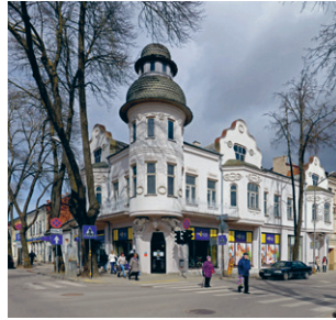
37. att. Daugavpils. Īres nams ar veikaliem Saules ielā 55. 20. gs. sākums