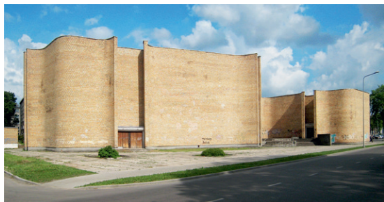
44. att. Daugavpils. Kinoteātris Vienības ielā 30. 1981. O. Krauklis