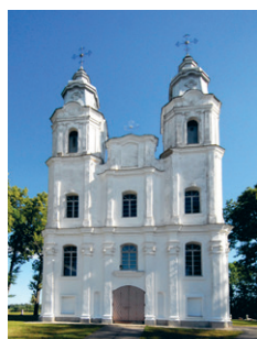
7. att. Piedruja. Svētās Jaunavas Marijas Debesbraukšanas katoļu baznīca. 1759–1780