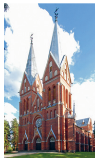
32. att. Viļaka. Vissvētās Jēzus Sirds katoļu baznīca. 1884–1891. F. fon Viganovskis