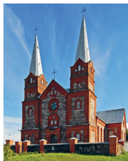
30. att. Izvalta. Svētās Annas Romas katoļu baznīca. 1896

Līdzīgi kā citviet Latvijā, stilistikajā aprītē ienāca gan neoromānika, gan neogotika. Daudzas baznīcas ir laukakmeņu mūra, parasti akmeņus kombinējot ar sarkanajiem ķieģeļiem, taču, atšķirībā no pārējās Latvijas, lielākā daļa šo Latgales baznīcu ir ar diviem torņiem. Raksturīgākās ir Svētās Trīsvienības Romas katoļu baznīca Vārkavā (1877), Svētās Annas Romas katoļu baznīca Izvaltā (1896, 30. att.), Romas katoļu baznīca Nīdermuižā (1901), Svētā Franciska katoļu baznīca Riebiņos (1907, 31. att.), Svētā Labrenča katoļu baznīca Stirnienē (1907–1914) un Vidsmuižas Romas katoļu baznīca Galēnos (1910–1912). Līdzīgas telpiskās