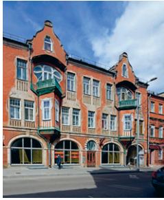
36. att. Daugavpils. Īres nams ar veikaliem Saules ielā 41. 20. gs. sākums