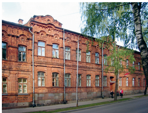
29. att. Daugavpils. Ēka Institūta ielā 6

Eklektisma arhitektoniskajām detaļām piesātinātā, vienmērīgi ritmizētā mākslinieciskā valoda vispiltāk jaušama Daugavpilī. Dzīvojamās ēkas Institūta ielā 6 un Saules ielā 1, kurās tagad izvietojusies Daugavpils Universitātes Mūzikas un mākslu fakultāte, ir eklektisma formālā paveida, tā sauktā ķieģeļu stila šedevri (29. att.). Ēkas ar figurālā sarkanu ķieģeļu mūrī veidotām fasādēm ir diezgan pamanāmas visu Latvijas mazpilsētu vidē, taču Daugavpilī šīs ēkas ar detaļu bagātību un daudzveidību tālu pārspēj visas citas.