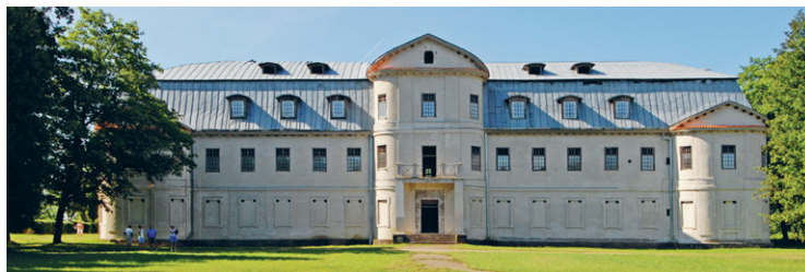
19. att. Krāslava. Muižas pils. 18. gs. otrā puse 20. att. Krāslava. Muižas pils "bibliotēka" (izpriecu villa). 1759

Dažādu tipu laicīgo celtnu jeb profānbūvju arhitektūrā baroka pēdas Latgalē, salīdzinot ar baznīcām, ir krietni vājākas.