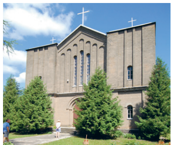
39. att. Indra. Balbinovas Vissvētās Trīsvienības Romas katoļu baznīca. 1935.–1940. P. Pavlovs