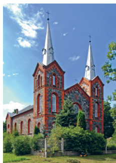
31. att. Riebiņi. Svētā Franciska katoļu baznīca. 1907