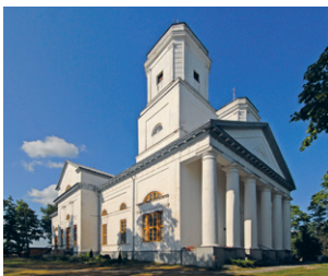
21. att. Varakļāni. Muižas pils. 1783–1789. V. Macoti