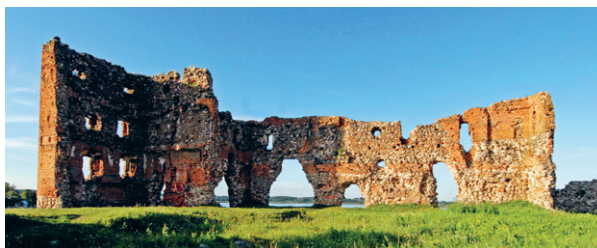
2. att. Livonijas ordeņa pils drupas Ludzā. 2010. g. foto