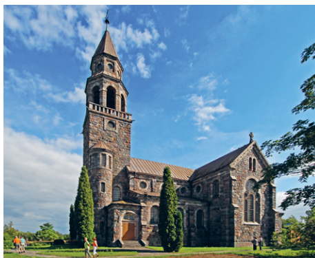
35. att. Višķi. Svētā Jāņa Kristītāja Romas katoļu baznīca. 1908–1930. K. E. Strandmanis