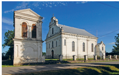
14. att. Šķaune. Landskoronas Vissvētās Trīsvienības katoļu baznīca. 1828