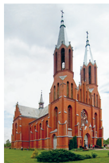
33. att. Līksna. Vissvētās Jēzus Sirds Romas katoļu baznīca. 1909–1912