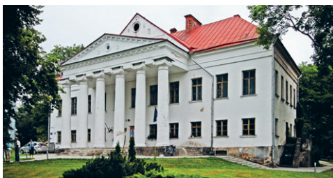
23. att. Briģi. Svētās Trīsvienības katoļu baznīca. 1800