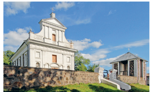
15. att. Ezernieki. Bukmuižas Svētā Ludviķa Romas katoļu baznīca. 1830