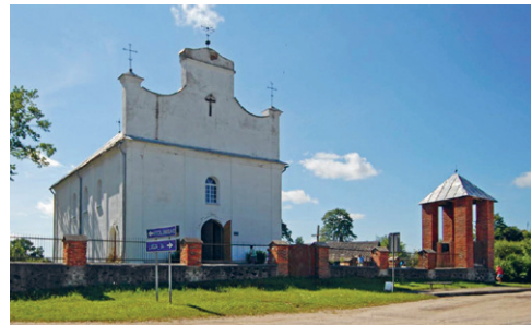
13. att. Rundēni. Svētā Krusta paaugstināšanas Romas katoļu baznīca. Ap 1820. g.