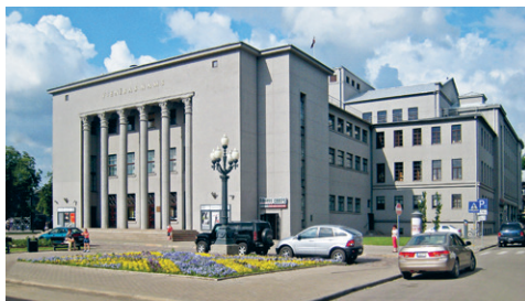
42. att. Daugavpils. Vienības nams Rīgas ielā 22A. 1936–1937. V. Vitands