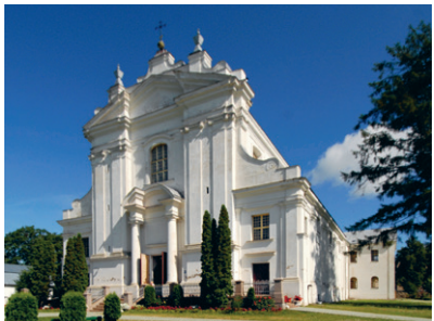
3. att. Auleja. Svētās Marijas Magdalēnas katoļu baznīca. 1709