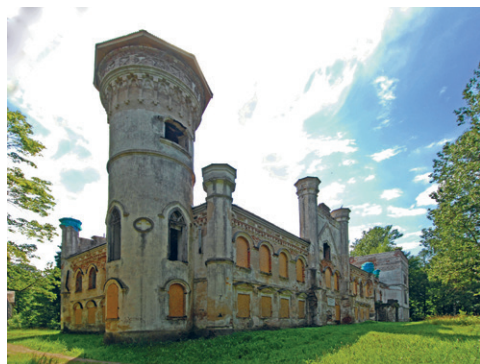
28. att. Preiļi. Muižas pils. 1860–1864. G. Šahts, A. Beļeckis