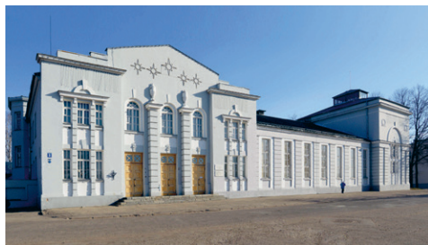
41. att. Rēzekne. Latgolas Tautas pils Brāļu Skrindu ielā 3. 1928 — 1929. P. Pavlovs

Apjomīgākā un arī ievērojamākā trīsdesmito gadu vidū celtā publiskā ēka Latvijā ir Daugavpils Vienības nams — daudzfunkcionāla celtnie, kurā atradās latviešu biedrības, dažādu biroju un kluba telpas, lielveikals, teātris un pat peldbaseins. Ēku pēc arhitekta Vernera Vitanda projekta uzcēla ārkārtīgi