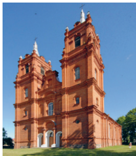
17. att. Rogovka. Nautrēnu Jaunavas Marijas bezvainīgās ieņemšanas Romas katoļu baznīca. 1901–1914