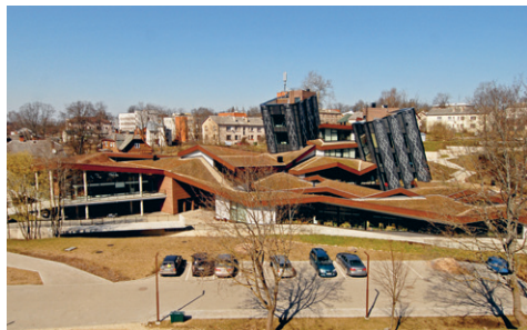
45. att. Rēzekne. Austrumlatvijas radošo pakalpojumu centrs “Zeimuļš” Krasta ielā 17. 2009–2012. R. Kalniņa un M. Krūmiņš