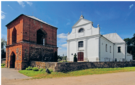
12. att. Asūne. Svētā Krusta pagodināšanas draudzes baznīca. 1816–1819

Baroka tradīcijas Latgales baznīcu arhitektūrā tomēr nebeidzās līdz ar šī stila vai tā vēlāko izstrāvojamu norietu. Arī eklektisma neostilos veidoto dievnamu klāstā ir spoži