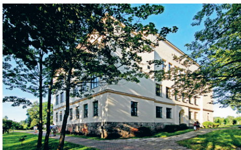
40. att. Zilupe. Valsts pamatskola Skolas ielā 1. 1925. I. Blankenburgs

nedaudz atgādina romānikas formu valodu, taču kopējais fasādes apdares detaļu vertikālums nepārprotami atbilst Art Deco estētikai. Baznīcas būvēšana pietiekami ātri neveicās. 1940. g. tā bija gatava pusbūvē, taču bez torņiem. Tie joprojām nav īstenoti.