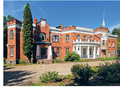
38. att. Lūznava. Muižas kungu nams Pils ielā 8. 1905–1911