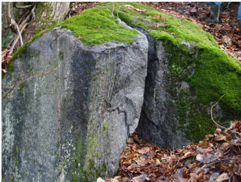
4. att. Saspridzinātais teiku akmens Pavāru pilskalņa dienvidrietumu nogāzē