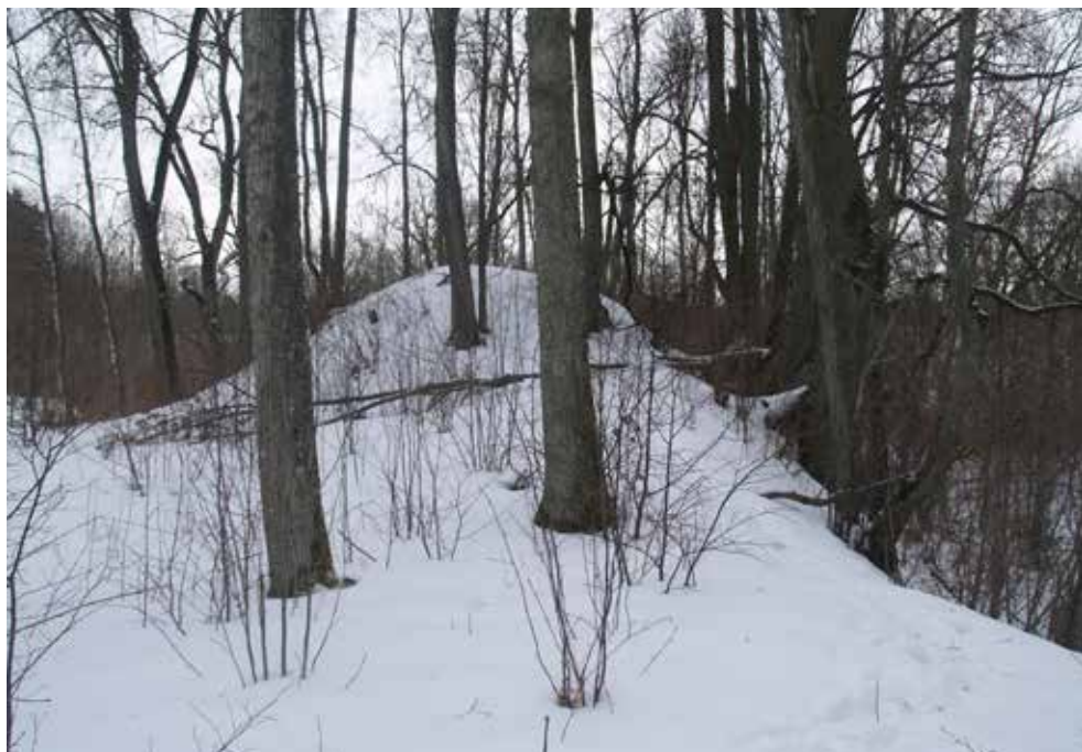
2. att. Pavāru pilskalna malas nostāvinājums