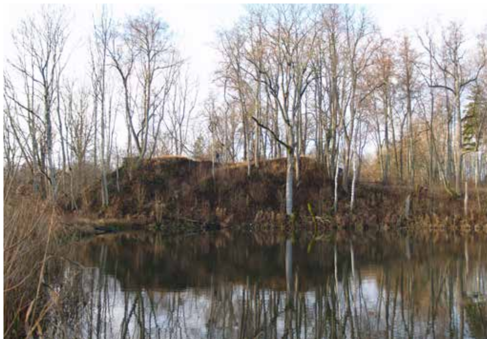
1. att. Pavāru pilskalns skatā no ZA pāri uzpludinātajiem dīķiem