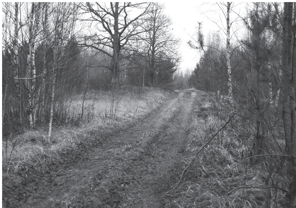
Garozas pilskalns vieta 2011. g. 2. decembrī.