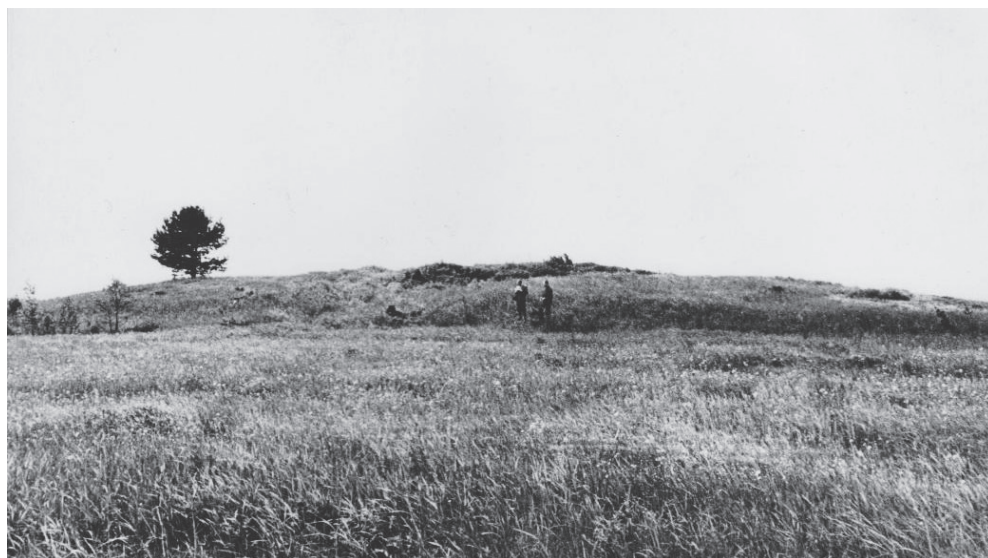
Garozas pilskalns 1969. g. 11. jūnijā.

Mūsdienās Lukstenieku mājas vairs nepastāv, tomēr māju aptuveno vietu var nojaust pēc pirmskara laika kartes. Spriežot pēc tās (40 — Baldone. Ģeod.-Top. daļas